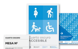
• Carteles del COA para el establecimiento y el cuarto oscuro