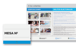
• Carteles para el establecimiento